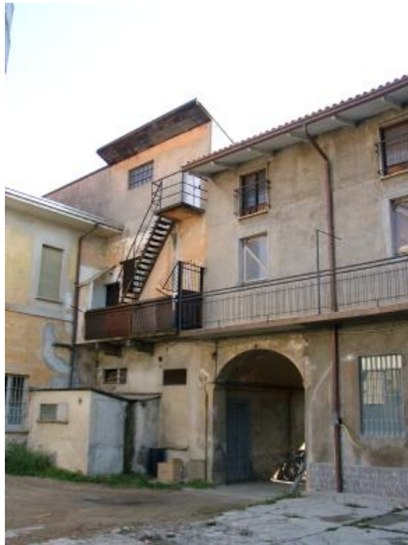
Scale, tetti, gabinetti