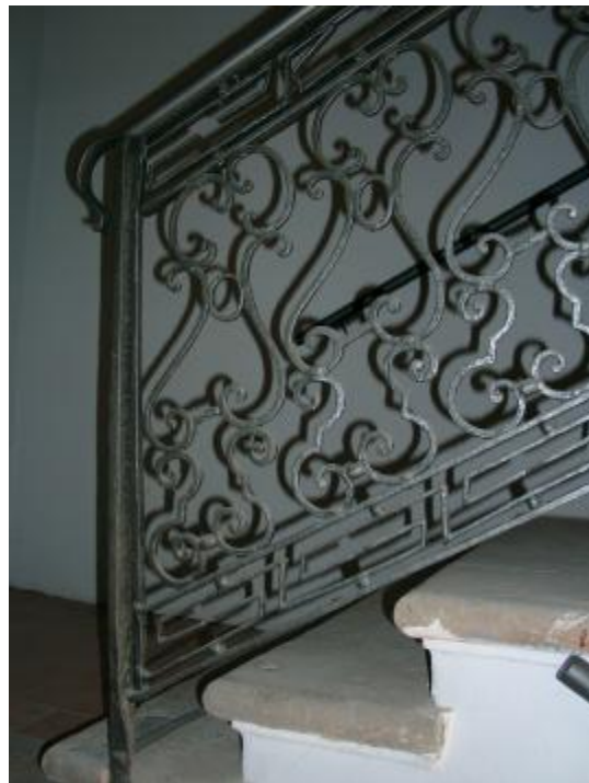
Un bel esempio di restauro