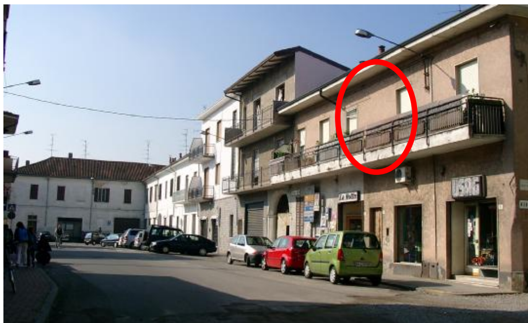
Dove si trova lo stemma nobiliare delle famiglie Fagnani e Clerici