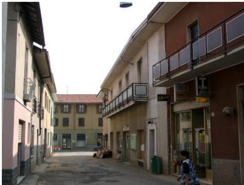
Palazzo visto da via Duca degli Abruzzi