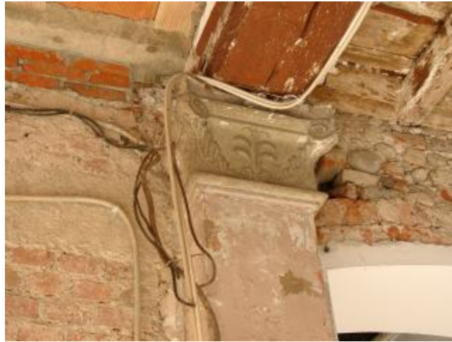
Soffitti non finiti e linee elettriche volanti