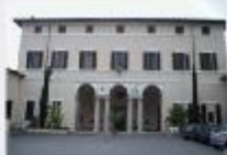
Robecchetto: Piazza Libertà Oggi