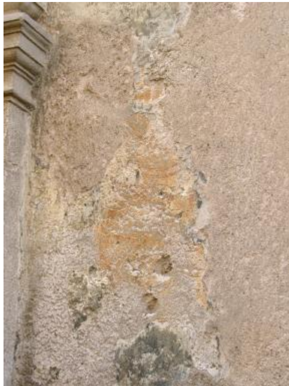
Affreschi sotto l'intonaco