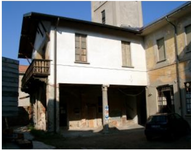
Il nucleo del palazzo e l'acquedotto costruito su una probabile torre medioevale