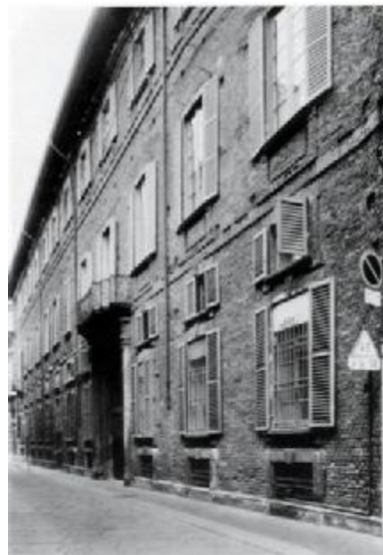
Villa di Robecchetto (ora Municipio) Palazzo Fagnani in via S. Maria Fulcorina, Milano