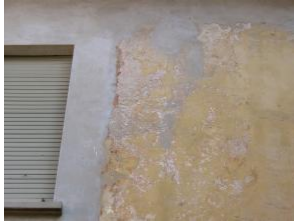
Resti di meridiana