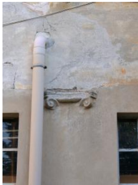
Colonne affogate nel muro