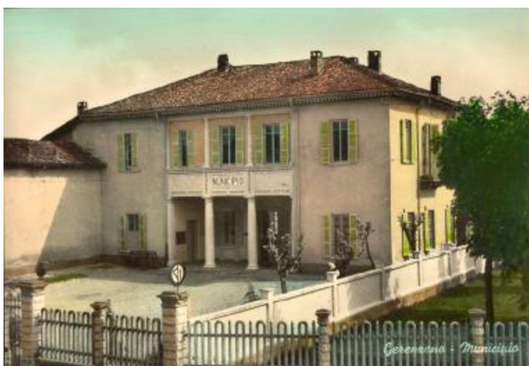
La villa di Gerenzano (ora Municipio)