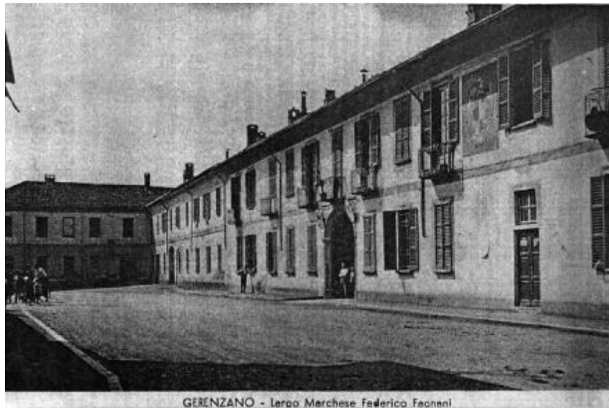
Il palazzo in largo Fagnani a Gerenzano