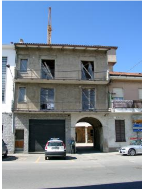
Il palazzo con la porta principale e le volumetrie aggiunte