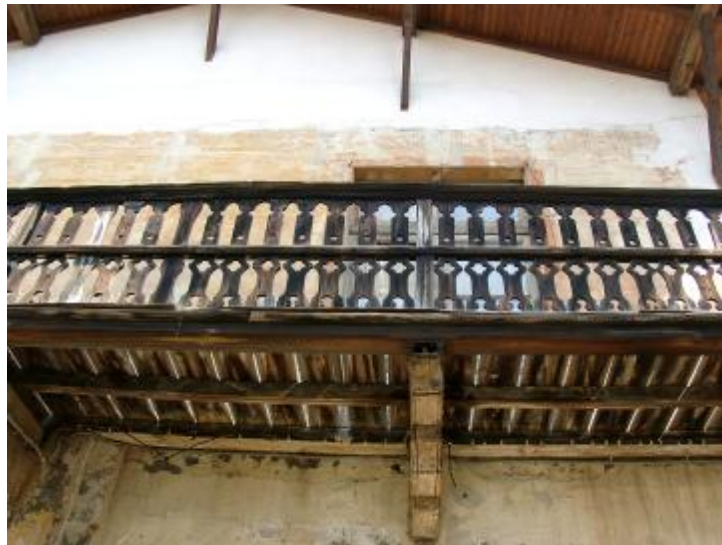
Balcone in legno e decorazioni sul muro (da salvare)