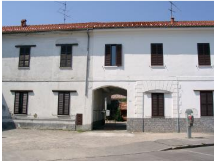
La corte in Largo Fagnani dove si trova la facciata della cappella