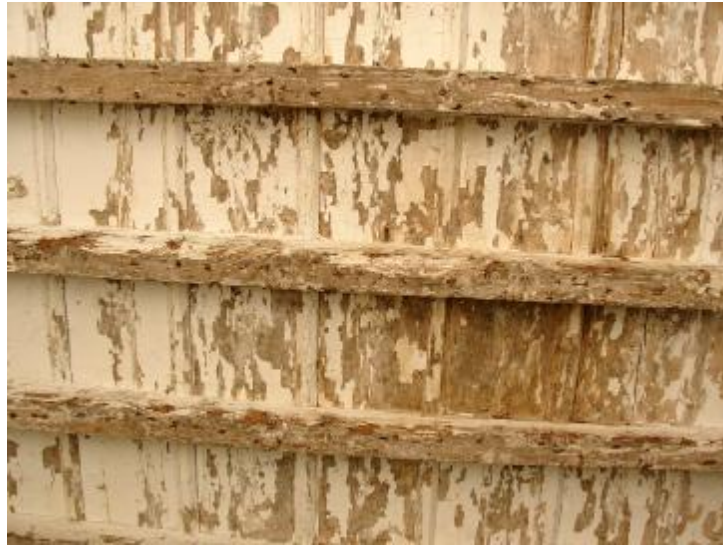
Soffitti a cassettoni