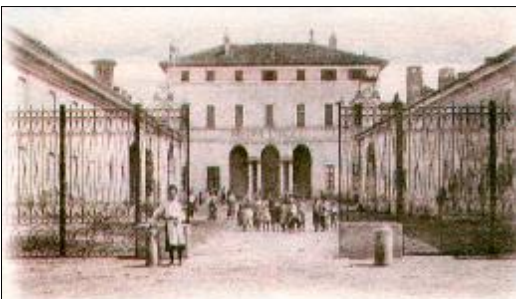
Piazza Libertà negli anni '30