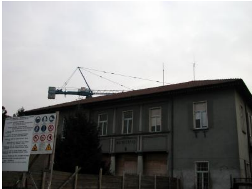
il palazzo comunale