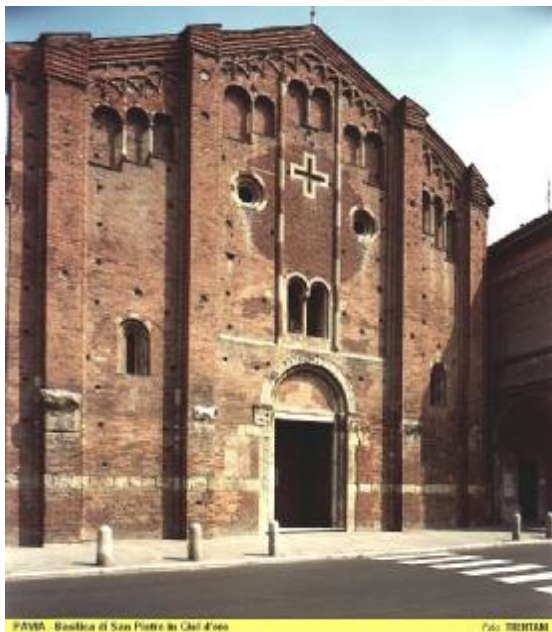
PAVIA - Basilica di San Pietro in Ciel d'Oro

E' assai difficile ricostruire passo per passo la serie degli avvenimenti di quelle epoche lontane, soprattutto per la scarsita', se non mancanza, di documenti causata dal caos delle invasioni e dal movimento dei popoli prima e dopo l'anno Mille.